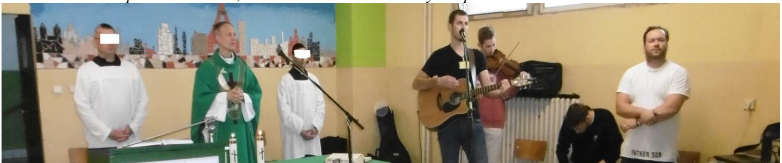
Foto: Košice Šaca počas sv. omše, ktorej sa zúčastnilo veľké množstvo odsúdených, pričom niektorí boli na sv. omši