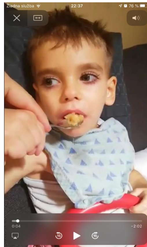
Foto: práve tento chlapček už po týždňových modlitbách. Chlapček pred modlitbami nemohol sám jesť, len cez