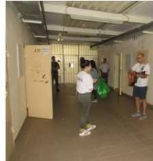
Foto: väznica Ilava zľava kuturka , OBR-chodba , oddelenie dievčatá, výkon väzby muži a nakoniec doživotné