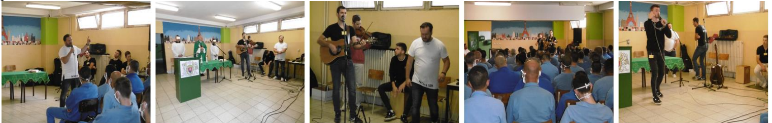
Foto: Košice Šaca počas svedectiev, modlitieb chvál a kresťanským repom.

koniec. Začal sa venovať hudbe, ktorá mu pomohla vyriešiť aj jeho finančné ťažkosti. Teraz chodí spolu so skupinou hrať kresťanský rap skoro každý víkend po koncertoch, detských domovoch a stretávajú sa so stovkami až tisíckami mladých ľudí. Minulý rok urobili po Slovensku turné a hrali takmer pred 25 000 ľuďmi, len v Bratislave mali na zimnom štadióne takmer 8 000 ľudí. Členovia skupiny Puer Dei sú súčasťou spoločenstva Dismas, ktoré sa začalo formovať v roku 2015 po prvých chválach kapely Lámačské chvály v Leopoldovskom ústave. Názov Dismas pochádza z mena tzv. kajúceho lotra (Lk 23, 39 - 43). Práve tento zločinec odsúdený na smrť dostal milosť na križi a už viacero rokov túto milosť i nádej spoločenstvo prináša takmer každý týždeň do väzníc. Dismas pôsobí zatiaľ najmä v slovenských a českých väzniciach a má približne 500 členov, z ktorých je viac ako 400 za múrmi väzníc. Služba spoločenstva Dismas spočíva v modlitbách, pôstoch a v ohlasovaní evanjelia, pričom ako nosnú časť považujú navštívenie a povzbudenie odsúdených (Mt 25, 36). Počas celého koncertu z člena spoločenstva sálala priateľská nálada a optimizmus, ktoré preniesol na divákov hneď po prvej skladbe. Odsúdených sa snažil motivovať k viere a porozumeniu. Odsúdení počúvali piesne, ktoré sa striedali s hovoreným slovom o osobných skúsenostiach a zážitkoch získaných počas jeho dlhoročnej kariéry. Hovoril aj o svojom živote, v ktorom posledné roky zohráva dôležitú rolu práve viera v Boha.“