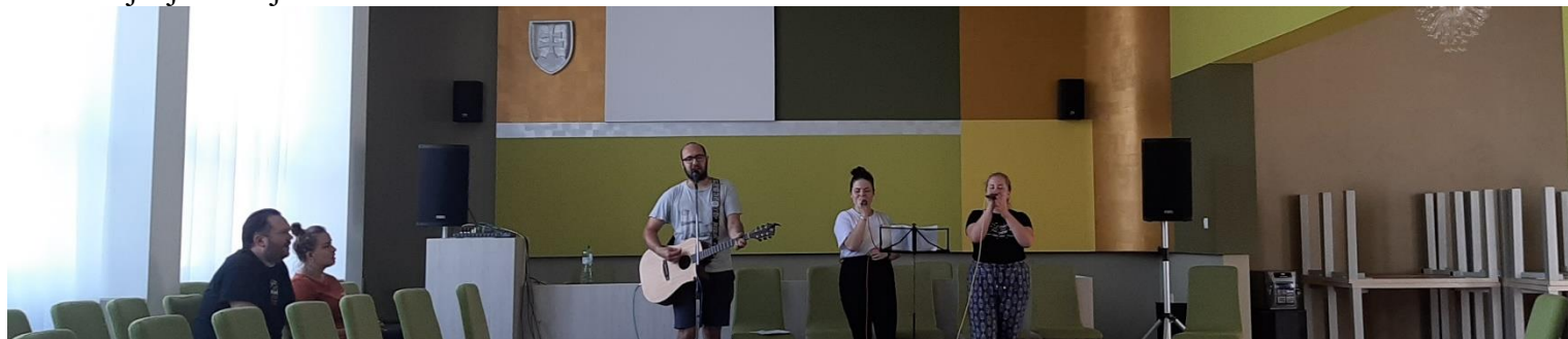
Foto: Kováčová spol. miestnosť, kde sedeli naše princezné. Do tohto zariadenia nechodievame často, ale Ocko chcel, aby sme prišli aj k nim a ďakujem mu za to, že nám dáva do srdca túto túžbu povedať im, aký dobrý je Boh a že chce zmeniť aj ich životy a ich rodiny, lebo draho sme boli vykúpení. *1Pt1,18-19 *1Kor7,23 * 1Kor6,20

láme Kristova láska. A vtedy som aj ja pochopila silu modlitby Otče náš, čo znamenajú všetky tie slová a uvedomovala som si, že Boh zomrel na kríži aj za mňa, ale aj za každého jedného väžňa. Chvála Pánovi!“ K Jankinmu svedectvu len dodám, že nekľáčali len zdraví, ale aj chorí, a keď som videl brata kľáčať so zlomenou nohou, tak som len v nemom úžase sledoval jeho vieru. A ešte jeden môj moment: Taktiež som videl jedného chlapa v rúšku, ktorý určite uvažoval nad týmito svedectvami a nad modlitbami chvál, ale ako som otvoril oči po modlitbe Pána a pozrel som sa práve na neho, to rúško mal úplne mokré a z jeho očí išla nesmierna radosť a vďačnosť naplnená slzami lásky od Ježiša Krista. Po Kráľovej sme sa presunuli do Liečebno-rehabilitačného strediska Zboru väzenskej a justičnej stráže - Kováčová.