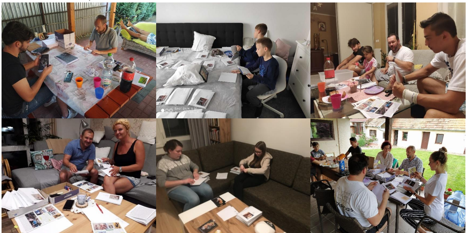
Foto: prinášam fotky rodín, priateľov a členov, ktorí pomáhajú pri balení NL, každé tri týždne.