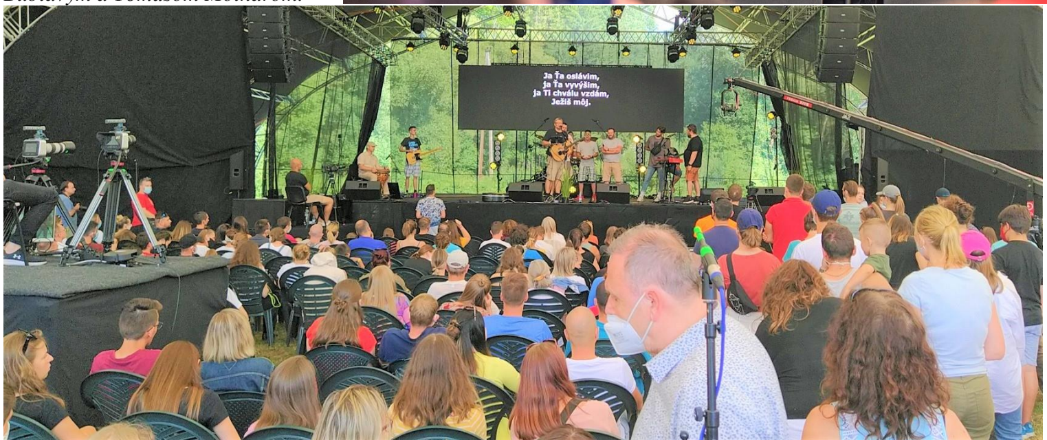
Foto: počas svedectiev spol. DISMAS, práve na Campfeste 2021.