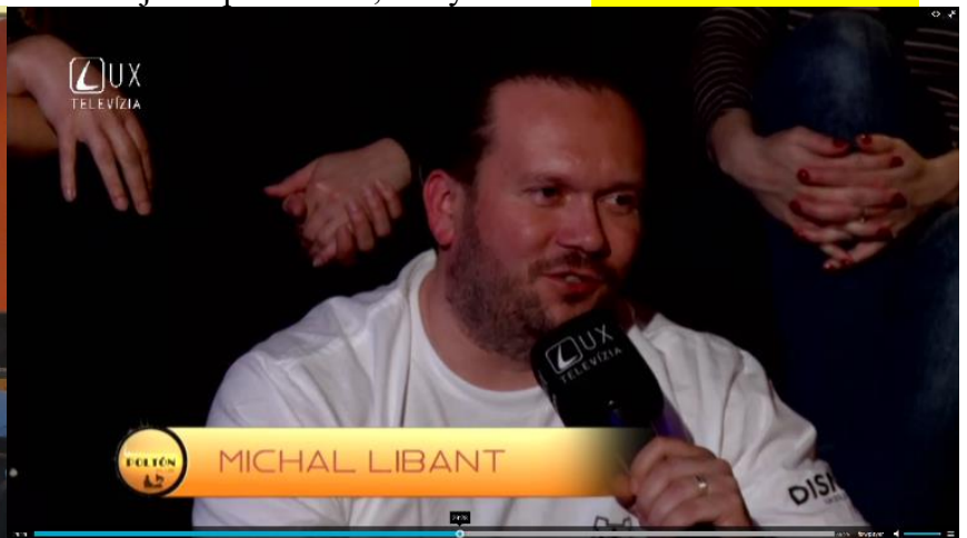
relácia Poltónklub (vyvrcholenie osláv po relácie pri pizze)