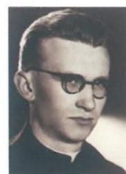
Titus Zeman 1915 - 1969