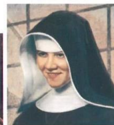
Zdenka Schelingová 1916 - 1955