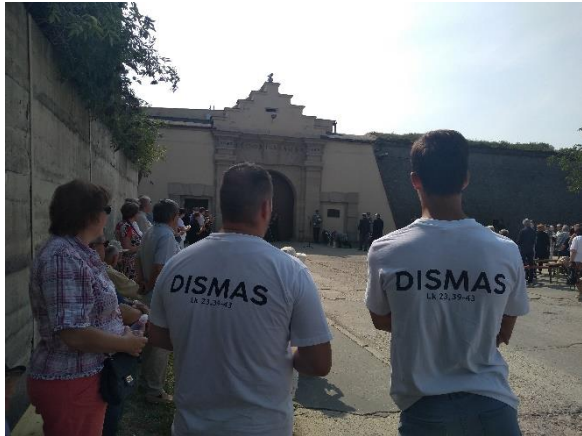
Foto 3*krát: Spoločenstvo Dismas sa zúčastnilo sv. omše, dňa 24.8. vo farskom kostole sv. Ignáca z Loyoly v Lepoldove, za nespravodlivo