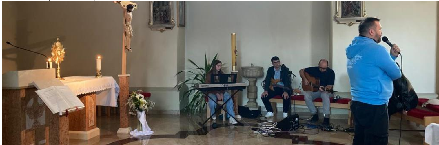
Foto: 8.10.2023 v poobedných hodinách sme boli pozvaní do Leopoldova , kde máme množstvo členov. Práve tam sa zišli rodičia birmovancov, ktorí s nami tiež slúžia a porozprávali sme im o odpustení a službe modlitby príhovoru.