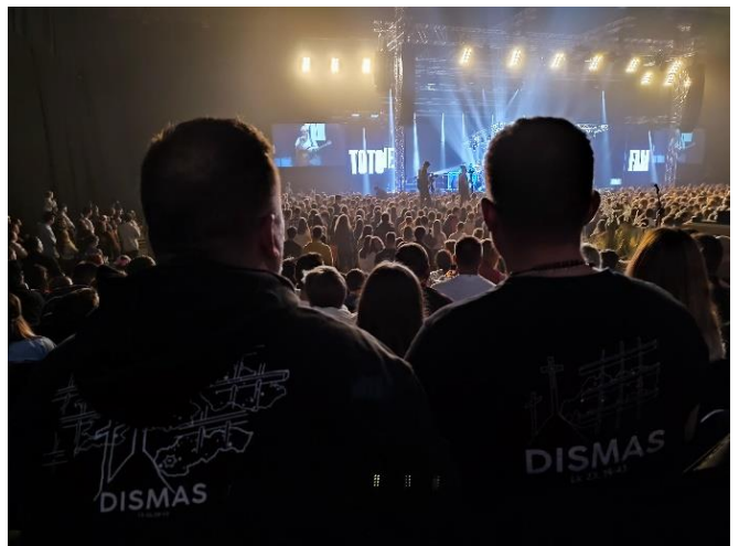
Foto: Dňa 27.10.2023 Bratislava Incheba arena Godzone