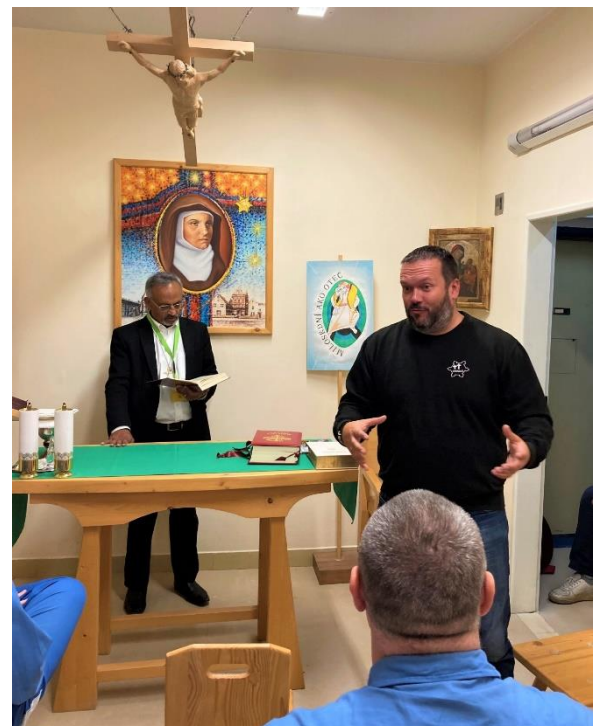
Foto: 2. stretnutie duchovnej obnovy v kaplnke vo väznici Banská Bystrica s našimi členmi. Z piatich odsúdených na doživotie sme sa rozprávali a svedčili sme až štyrom. Chvála Pánovi. Boh je mocný. Oficiálny zdroj: https://www.ordinariat.sk/duchovna-obnova-v-ustave-banska-bystrica/