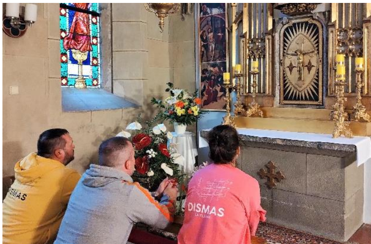
Foto: Slovensko, benediktínsky kláštor, kde sa nachádza vzácna relikvia Kristovej krvi.

Prestal som tak dychtiť po duchovných veciach a začal som dychtiť po tých materiálnych. Celé to prišlo pomaly a nepozorovane, až sme sa tento rok spolu s manželkou modlili za obnovenie živej viery, za viac ohňa a za spoločenstvo. Išli sme na Nové Svitanie, do Medjugorja a na CampFest. Znovu sa každý deň spolu modlíme, čítame si Božie Slovo a snažíme sa počúvať a uskutočňovať, čo nám hovorí Duch Svätý. Spoločenstvo v Bratislave sa akurát rysuje, ale cítime, že náš domov je vo farnosti na Sekieri vo Zvolene. Pán začal posúvať veci v našich životoch a rodinách, ktoré dlho stagnovali a znova sme sa začali zdieľať s blíznymi so svedectvom a modlitbou. Tešíme sa, čo má Pán pre nás pripravené. Nech je Bohu všetka sláva.