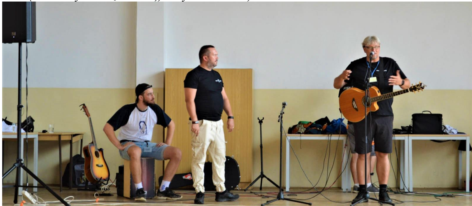
Foto: väznica Hrnčiarovce nad Parnou, kde odsúdení zo spoločenstva hrali a slúžili s nami chvály.