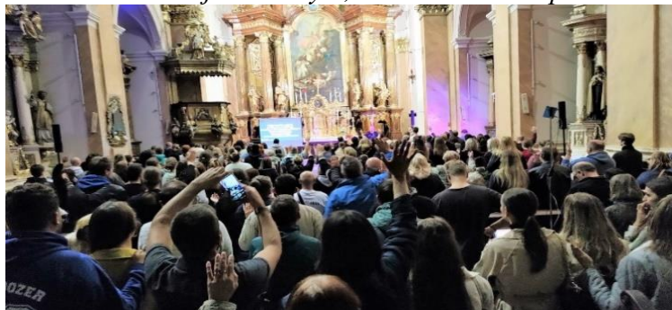
Foto: V pondelok 3.10.2022 sme sa viacerí členovia spol. DISMAS stretli v Trnave na modlitbe chvál, ktoré viedli