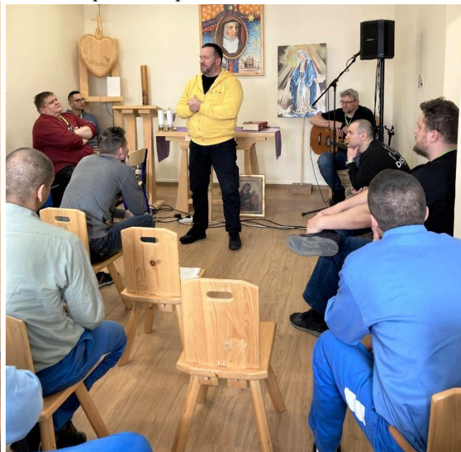
Foto: väznica v Banskej Bystrici, LCH, prevzaté: https://www.zvjs.sk/sk/aktuality/uzdravenie-rodinnych-vztahov