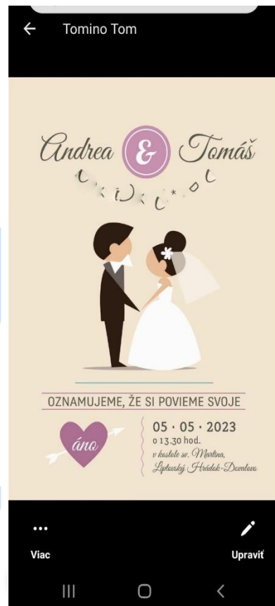
Foto 1: 6.5.2023 plagát najväčšej udalosti DISMASU v roku. Si pozvaná ako vždy a aj tvoja rodinka a známi.

Foto 2: Facebook Dismasu, kde nám tiež prichádzajú prosby o modlitby, ktoré následne dávam do úmyslov spol.