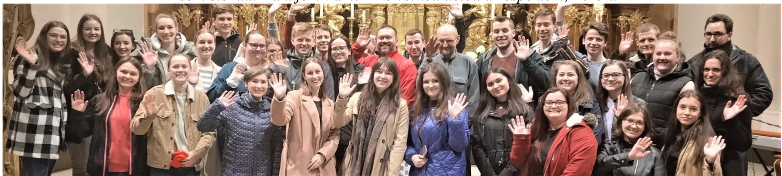
Foto: Ježiuvský kostol Trnava so študentami z UPeCe , kde ma pozvali svedčiť. Zároveň Ťa Źehnajú a pozdravujú.