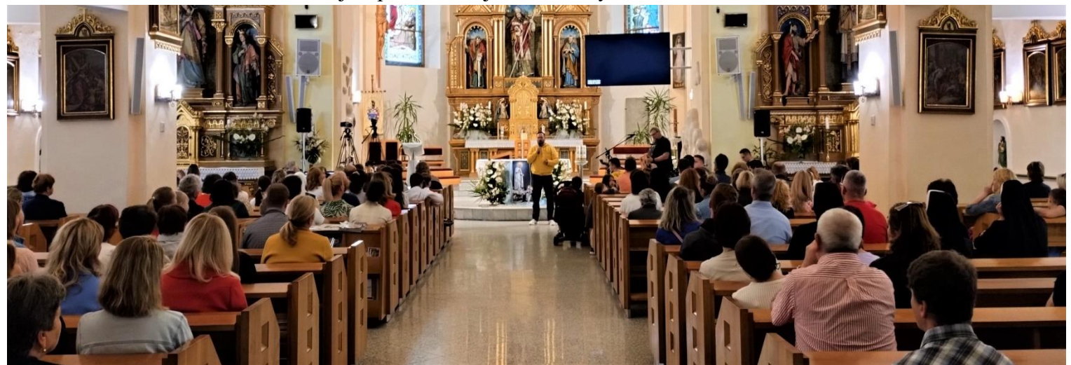
28.5.2023 kostol Sv. Martina, Trstená, pri Oravskej priehrade počas svedectiev DISMAS.