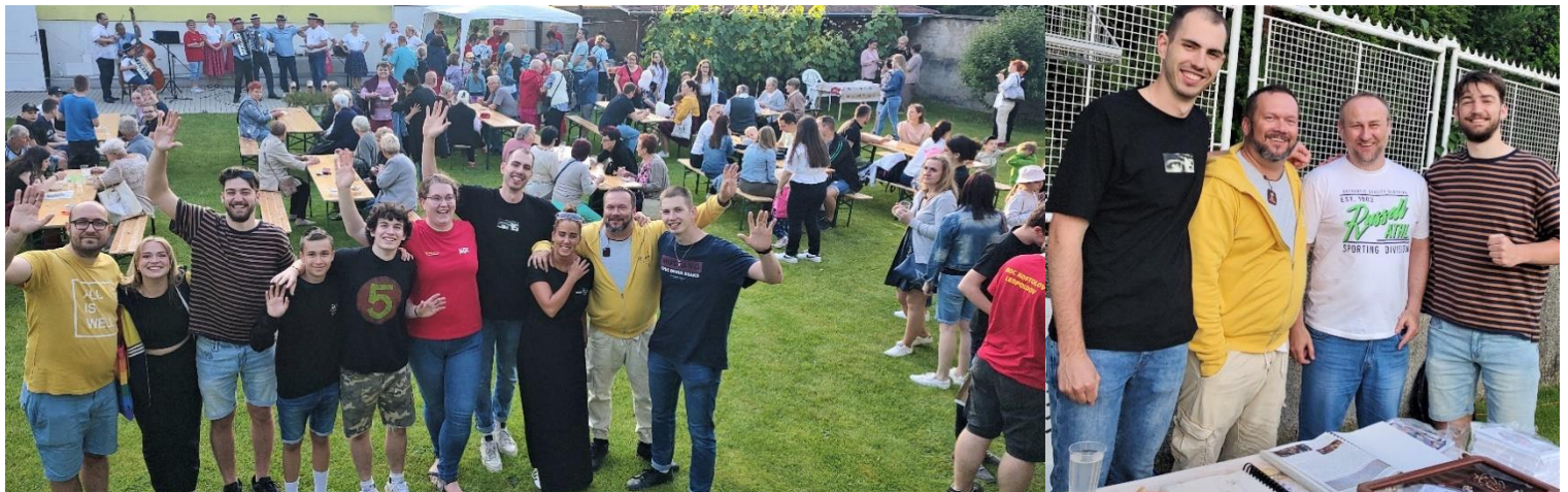
Foto: fara Leopoldov, kde sa uskutočnilo podujatie „NOC KOSTOLOV“ a boli sme pozvaní, aby sme odprezentovali