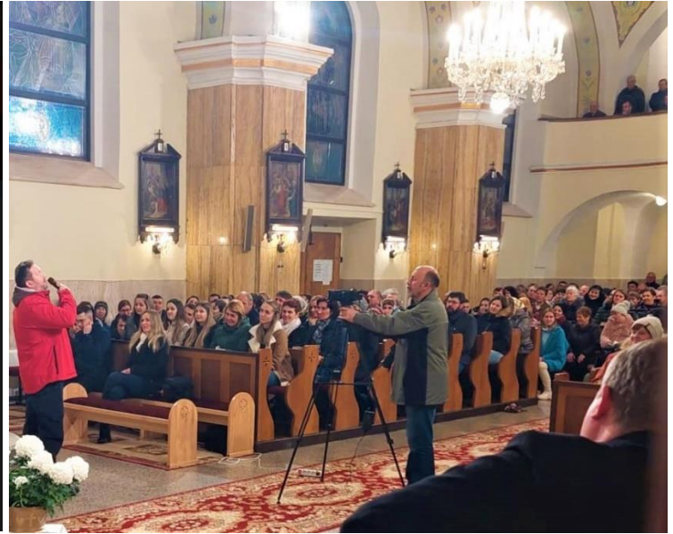
Foto: Kostol Nanebovzatia Panny Márie, Hladovka, Orava, Slovensko, počas Púdobých misií dňa 16.11.2022.