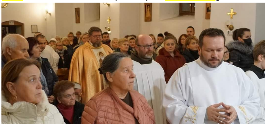
Foto: 17.11.2022 Kostol Všetkých svätých, obec Rabčice počas svedectiev, kde sme boli zavolaní slúžiť mladým.