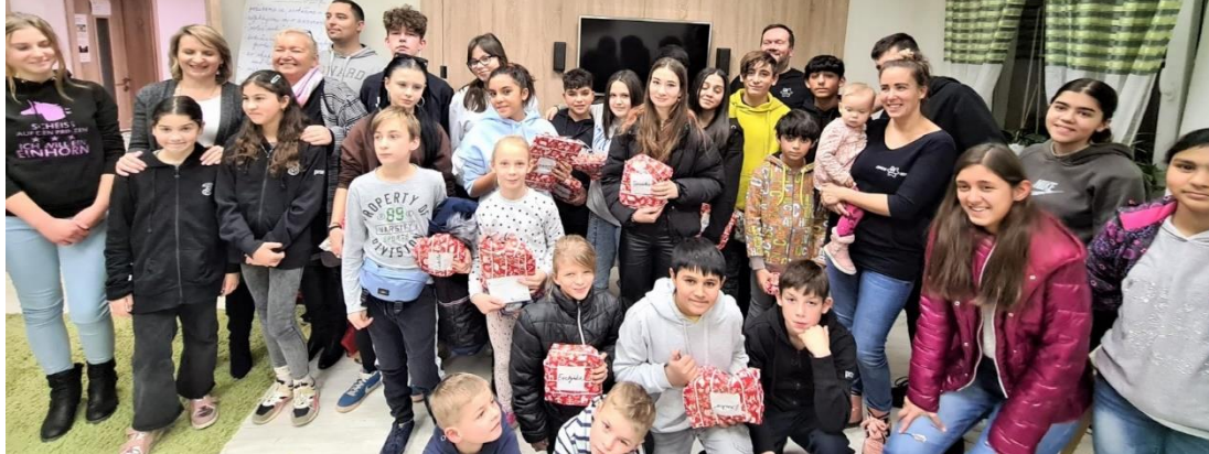
Foto: 24.11.2022 štvrtok, Centrum pre deti a rodiny Trnava (bývalý detský domov). Boli sme pozvaní, aby sme spravili prednášku a svedectvá o tom, že Boh dáva šancu všetkým. A viem, že niektoré deti majú vo výkone trestu aj rodičov a moja manželka deň predtým zorganizovala balenie 40 darčeka práve pre tieto