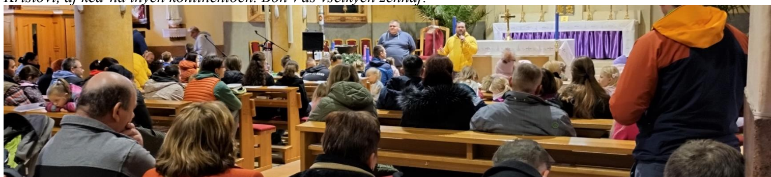
Foto: 27.11.2022 Oščadnica Kostol Nanebovzatia Panny Márie.