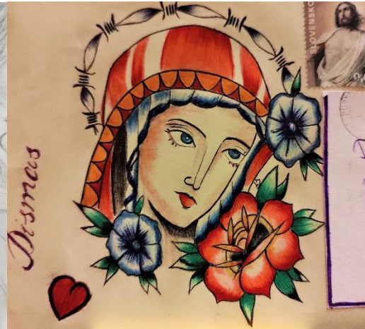
Foto: obálka od Zoltána, väznica Opava; kresba od Jozefa, väznica Ilava; obálka od Ľubomíra z Dubnice

Časť listu od Jána z väznice Mírov: „Jmenuji se Honza, je mi 25 let a sedím za vraždu ve věznici Mírov. Poprvé jsem se o Vás dozvěděl, když jste uspořádal perfektní koncert Ega u nás ve věznici. Bylo to skvělé oživení! Děkuji Vám. Vzpomínám si na jednu situaci, která dokládá jak chytře šíříte Slovo Boží. Já jsem věřící, ale je tady spousta lidí, kteří mají postoj typu „kdyby jsi věřil, tak nepácháš“, a právě jeden z nich mi po koncertě řekl, že je rád zato, že se za něho Ego pomodlil. (díval se z okna z cely) Od Ega se mi nejvíce líbí píseň „Žijeme len raz“, která mě inspiruje/motivuje už jem svým textem. Moc se mi líbily Vaše dojemné příběhy, které jste vkládal mezi písničky, protože se velice dotkly mého srdce (myslím, že nejen mého). Už nevím, který to byl, ale při jednom příběhu jsem si mnohem více uvědomil jak moc je důležitý lidský život a co musí být pro matku ztratit dítě. Načůž jsem zase začal přemýšlet o důstojné omluvě pozůstalým. (Nejdříve jsem se k činu priznal, ale poté jsem měl obhájce, který měl „taktiku“ vinu popírat, takže ikdyž jsem se chtěl omluvit a doslova jsem cítil povinnost projevit sebereflexi, „nemohl jsem“.