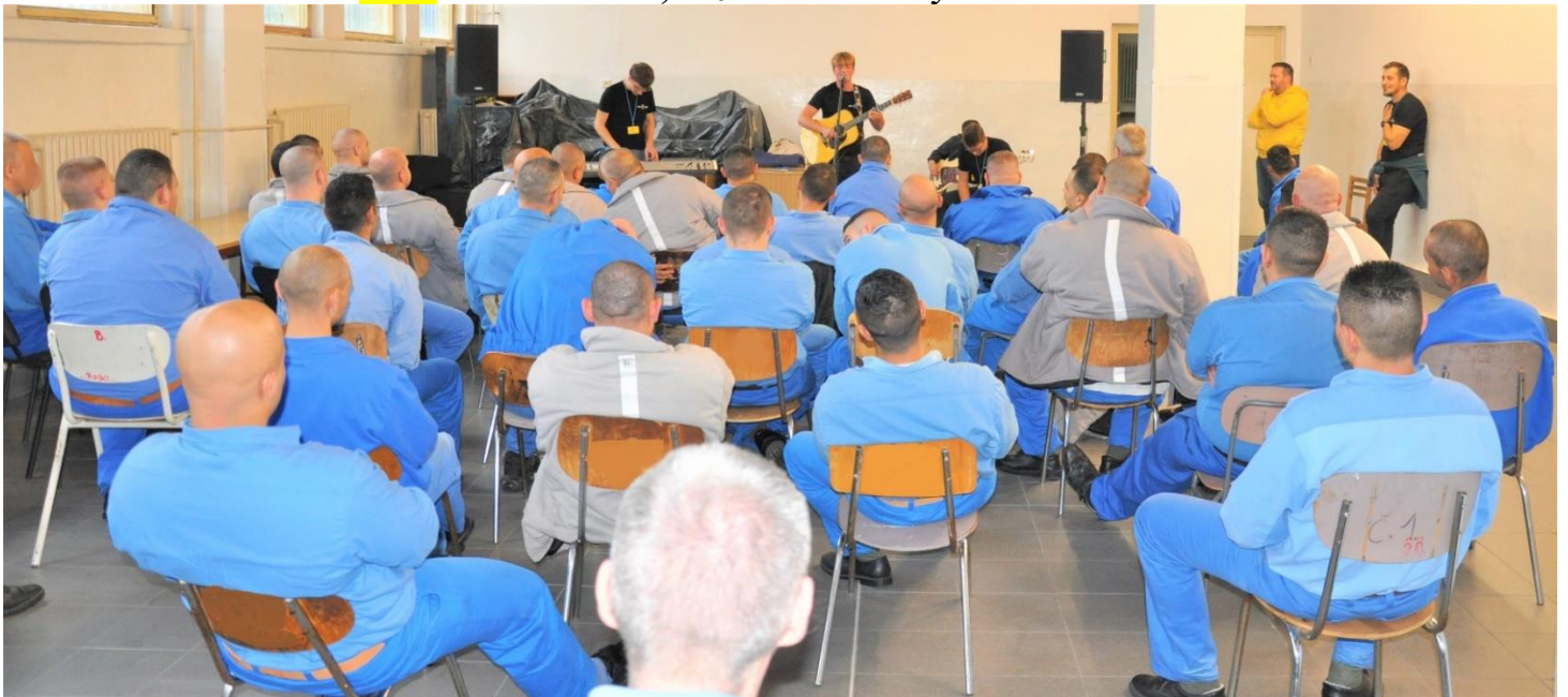
Foto: kapela RODS, väznica v Želiezovciach, Slovenská republika počas evanjelizácie spol. DISMAS.

Foto: obálka od Jána, väznica Banská Bystrica