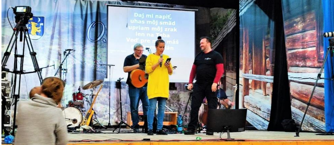
Foto: 25.11.2022 Oščadnica, kultúrny dom, Live Stream LCH počas svedectiev nášho spol. DISMAS

väznica Ilava z augusta 2022, vystúpenie Ega na doživotných trestoch s členmi. Prinášame ti túto fotku, nakoľko až teraz bola zverejnená na oficiálnych stránkach, ale oplatilo sa, lebo fotky z doživotných trestov sú rarita.