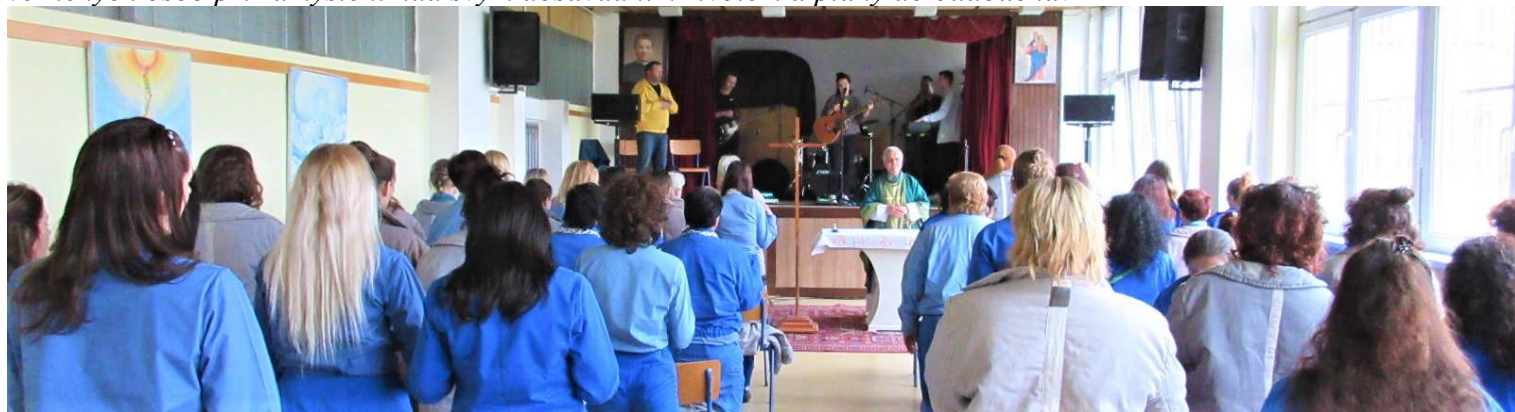
„Hudobná skupina ALIVE si pre odsúdených pripravila pásmo s tematickým