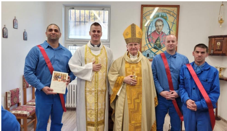
Foto: Väznica Banská Bystrica - Kráľová, biskup Rábek udelil sviatosť birmovania trom odsúdeným aj z nášho spoločenstva.

(po Vrchním soudu jsme se rozešli, protože mám dlouhý trest, ale je to úžasná žena a moc jsem ji miloval. Paradoxně můj pobyt ve vazbě ještě více prohloubil náš vztah, ještě více jsme si jeden druhého dokázali vážít a zjistil jsem, že mám víc skvělejší ženu než jsem si myslel) a Vás dlouho neznám, ale i tak Vám důvěřuju, víc než některým lidem, které znám déle. Nevím zda by to bylo možné, ale s vězeňským kaplanem jsem se bavil i o možnosti setkat se po propuštění s pozůstalými, což bych rád uskutečnil, pokud by měli zájem. Chci Vás poprosit/požádat o radu, o Váš názor, popřípadně o pomoc pozůstalé kontaktovat či o cokoliiv co uznáte za vhodné.