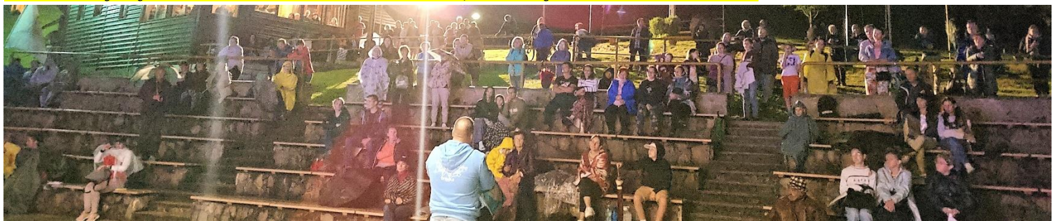
Foto: pred väznicou v Levoči 6.8.2023 s Poetikou Musicou

Misia I: Tak prichádza čas, ako každý rok, kedy nám v prípade záujmu zasielajte mená vašich detičiek cez projekt Anjelský darček . Je to projekt, kde chceme poslúžiť tebe a hlavne tvojim deťom. Väčšina odsúdených má doma deti a tieto deti bývajú na Vianoce samy, ďaleko od ocka , nakoľko je vo výkone trestu. Lenže tieto deti majú tiež túžbu dostať od ocka darček, veď ony nemôžu za to, že on nie je doma. Ak chceš, aby namiesto teba zrealizovalo spol. Dismas obdarovanie tvojho