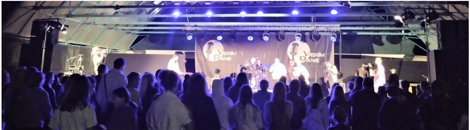
Foto: 22.7.2023 o 23.00 hod. sme prišli svedčiť do Námestova na sever Slovenska na festival Verím Pane. Prišiel aj