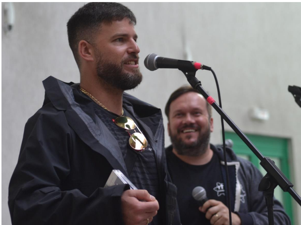
Foto: Trenčín Juh, kostol svätej rodiny a cca 50 členov spol. Dismas vystierajú ruky k tebe a žehnajú ti.