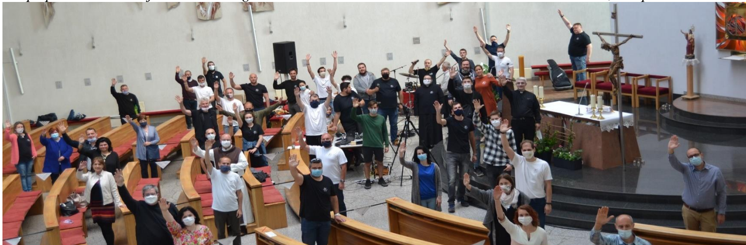
Foto: Trenčín Juh, kostol svätej rodiny a cca 50 členov spol. Dismas vystierajú ruky k tebe a žehnajú ti.