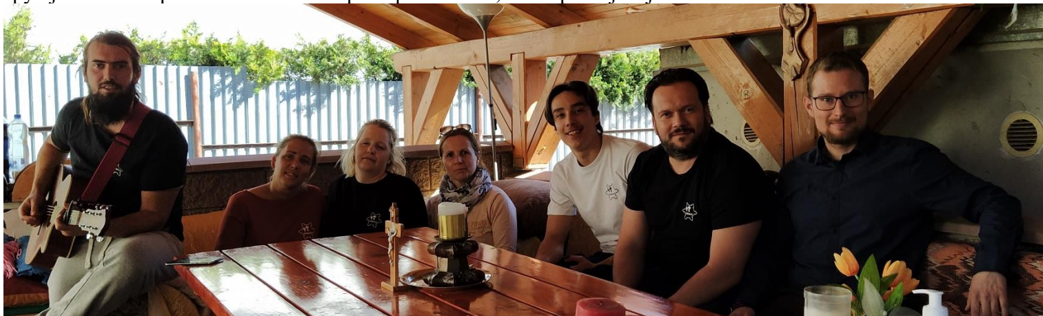
Foto: modlitby chvál počas spoločného stretnutia nášho spol. Dismas. Vďaka ti Ocko.

spýtajte sa naň kaplána a nech vám ho pustí po sv. omši, alebo pri nejakej aktivite.