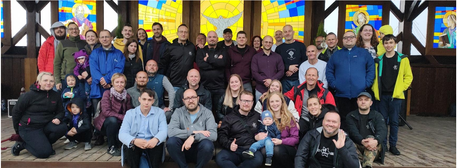
Foto: Dňa 6.5.2023 sme mali 8. výročie založenia väzenského spoločenstva DISMAS. Bolo nás veľa a bolo by nás

omnoho viac, ak by sa členovia nezľakli dažďa, ktorý sa predpokladal, ale pršalo minimálne, ale za to svietilo slnko. Ono je to tak, že opica hodí pod naše nohy malé polienko a hneď sa toho zľakneme a ustúpime. Foto: náš biskup otec Rábek, o. Luboš K., dekan Jozef S. Foto: s rehoľnou sestričkou, modlitebníčkou nášho spol.