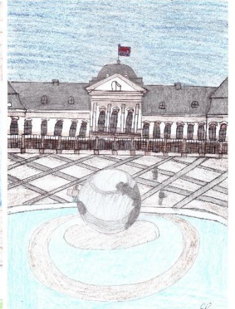
Foto: 3 x obrázok od Štefana z väznice v Trenčíne, ktorý viackrát do mesiaca posiela svoje kresby.