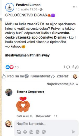
Foto: webová stránka LUMEN Festivalu Trnava, kde máme dva workshopy. Uskutoční sa, ak Pán dá, 10.6.2023

Určite sa ti často stáva, že či už spoluodsúdení, alebo rodina, známi, blízni, majú rôzne otázky, pochybnosti o existovaní Ježiša Krista. Vtedy sa ich jednoducho opýtam, aký je rok. Oni odpovedia „veď to vie každý, 2023“ a potom sa ich opýtam, že od kedy celý svet ráta, resp. prečo je práve 2023. No a po chvíľke zamyslenia odpovedajú, že „od narodenia Ježiša Krista“. No a potom sa ich pýtam, že keď sa hrajú na ateistov, tak prečo si na náhrobné kamene dávajú kríže, keď tomu neveria. No teraz by som ti dal text z katechizmu