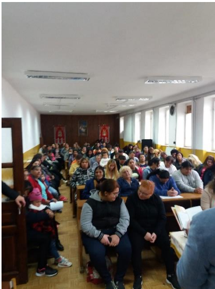
Foto: stretnutie rómskych žien-svedectvo