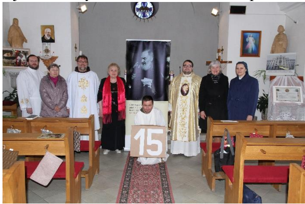
Foto: kostol Ducha svätého s relikviou Pátra Pia (pod jeho obrazom vľavo)