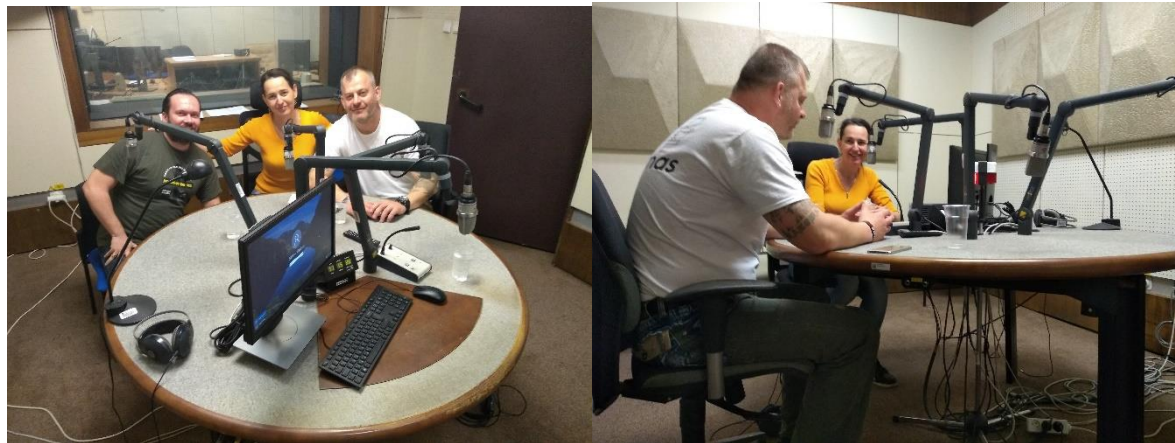
Foto: Slovenský rozhlas v štúdiu v Bratislave.

by malo byť na veľký Piatok od 12,00 do 14,00 hod .cca, len podotknem, že sú enormne tlaky, aby naše svedectvo o Dismase neprešlo ..proste veľká cenzúra, ale Pán to žehná a kde On otvorí, už nikto nezavrie. AMEN!