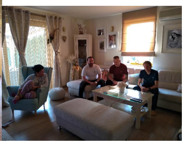
Foto: návšteva sestry a bratov v Prešove