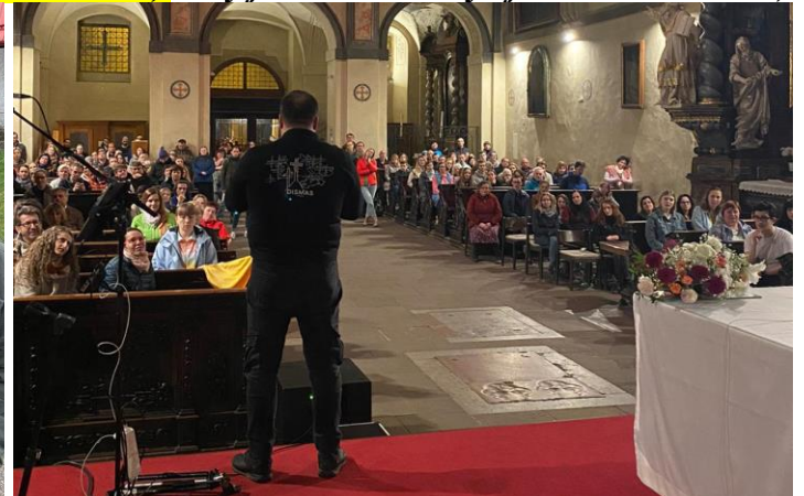
Foto: 2.4.2024 sme boli pozvaní do Prahy do Chrámu Panny Márie Snežnej, ktorý založil cisár Karol IV. v roku 1347.