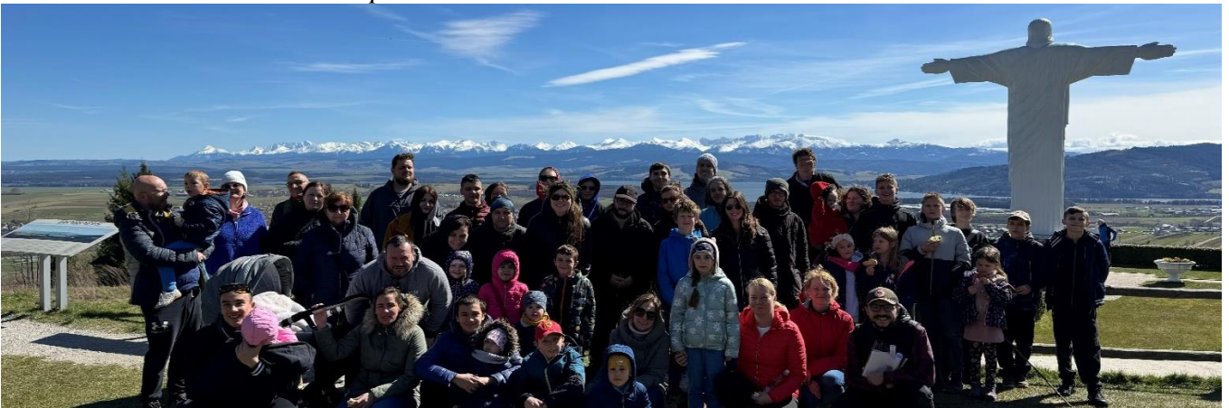
Foto: Klin obec na Orave, odkiaľ vidíte Vysoké Tatry a je tam najväčšia socha Ježiša Krista na Slovensku „Rio de